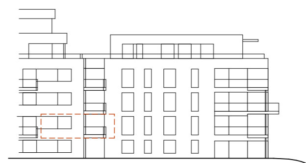
ANSICHT NORD-WEST (Hafenstrasse)