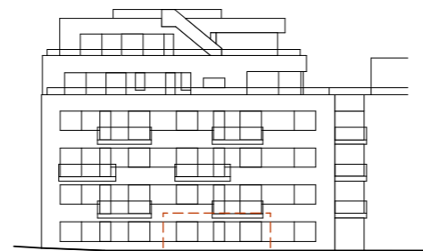
ANSICHT NORD-WEST (Hafenstrasse)